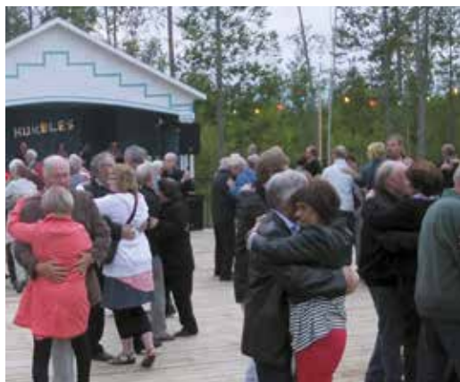
Rävemåla dansbana, byggd 1937, återinvigdes sommaren 2013. Många andra dansbanor från förr, med de tidstypiska kulörta lamporna, är idag borta.

I Smålands Musikarkiv finns stora samlingar av unikt musik- och dansmaterial från i första hand Kronobergs län, Småland och södra Sverige. Arkivet är öppet för alla och har till uppgift att vara en källa och kunskapsbas för utveckling av det regionala musik- och danslivet.