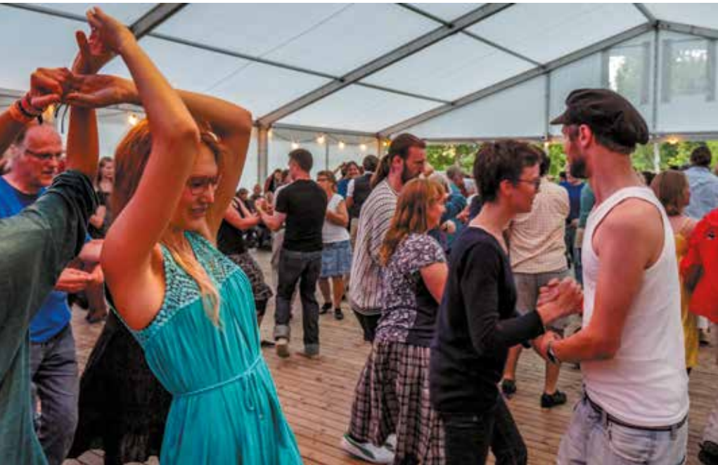
Korrö Folkmusikfestival sommaren 2015.

Smålands Musikarkiv är en samarbetspartner till musik- och danslivet, forskarvärlden, olika utbildningsinstitutioner och en resurs för allmänheten. Arkivet är en del av Musik i Syd vilket bland annat innebär att vi är med och arrangerar Korrö Folkmusikfestival.