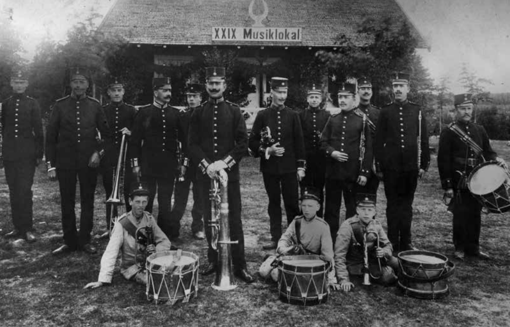
Delar av Kronobergs regementes musikkår utanför sin övningslokal, kallad "Tutaryd" i folkmun, på Kronobergshed, 1904.

Ett fylligt referensbibliotek är öppet för våra besökare. Där finns böcker och tidskrifter inom musik- och danshistoria, kultur- och lokalhistoria samt etnologi.